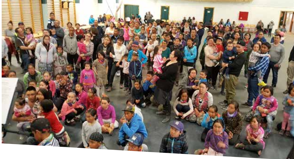
Børnene og deres familier hører om hvordan MIO underviser skoleelever i børns rettigheder.