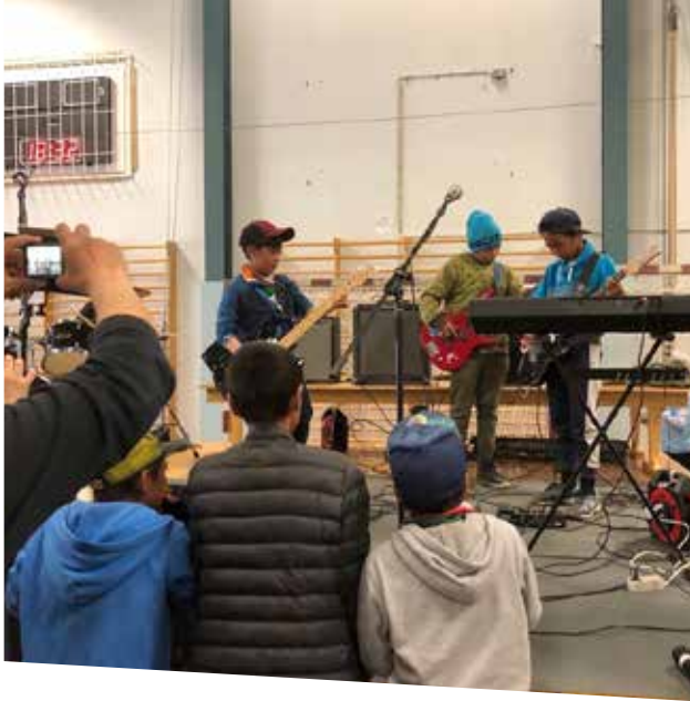
Børnebandet havde selv arrangeret al musikken og spillede til stor begejstring for alle.