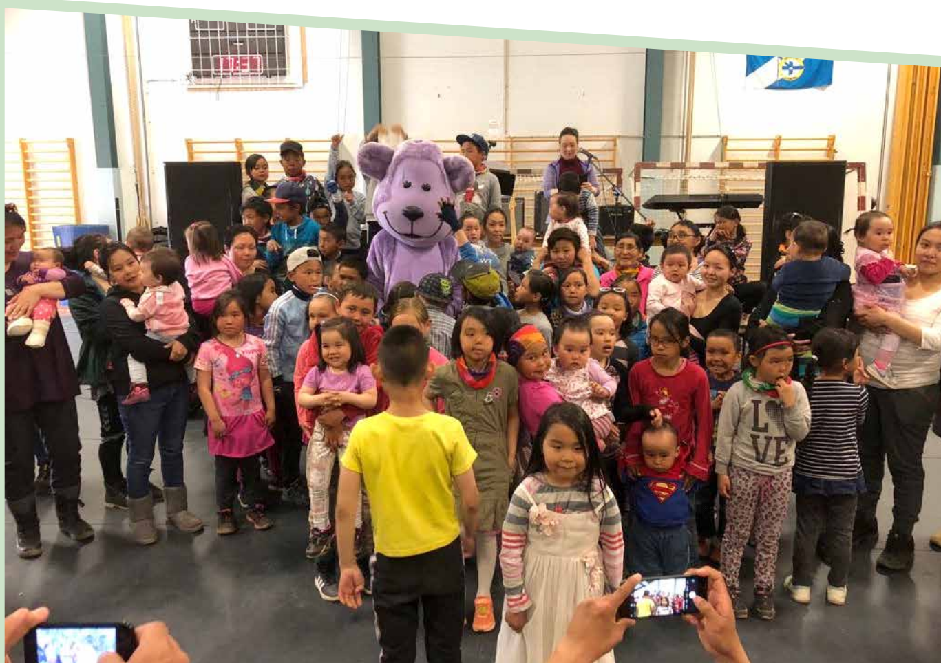
Kammak-Bamsen kom på besøg og hilste på.