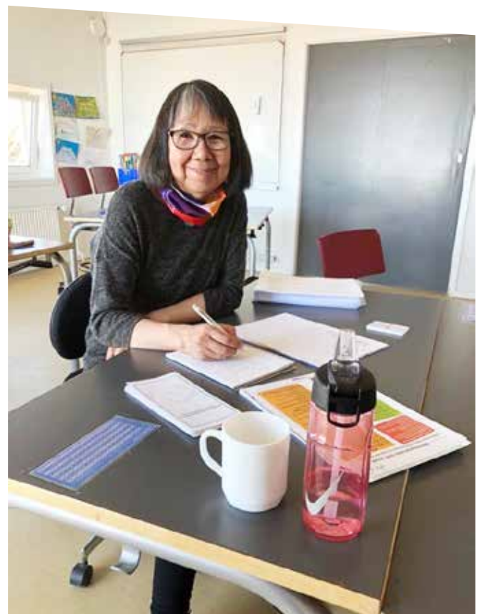
Inunnik Isumaginninnemut siunnersorti Nauja innuttaasut saaffiginnissutaannik allattuisoq.