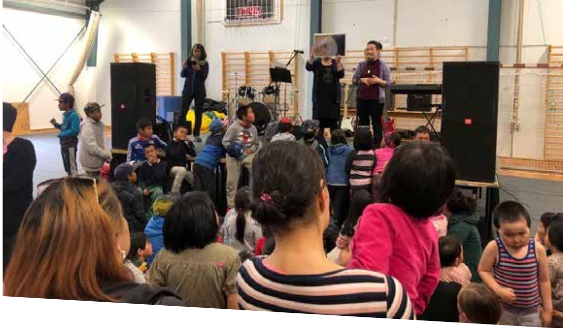
Meeqqat Illersuisuat Aviâja Egede Lyngø meeqqanullu siunner- sorti Ellen Bang Bourup Qaanaap timersortarfiani isersimasunut MIO'p meeqqat pisinnaatitaaffii pillugit ilinniartitsisamerat pillugu oqaluttuurtut.