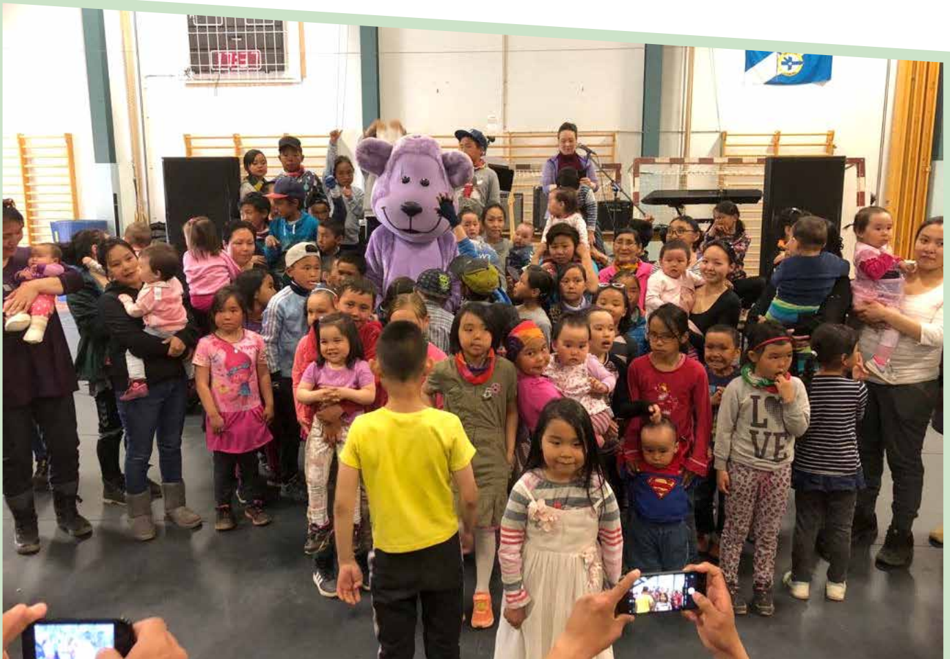
Kammak-Bamsi ilassinnikkiartorluni pulaarpoq.