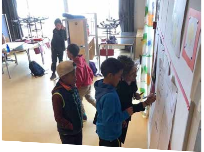
Peqqinnissaq pillugu arpatsitsinermi peqqinnartut peqqinnangitsulluunniit suuneri meeqqat titartarpaat allallugilluunniit.

Angajullit apeqqutinik suliaqaqqittarput, meeqqat illersorneqarnissamut pisinnaatitaaffeqarnerannut tunngasutigut, ikiorneqarnissaminnut pisinnaatitaaffeqarnerannut, toqqissisimanartumillu angerlarsimaffeqarnissamut pisinnaatitaaffeqarnerannut tunngasunik. Meeqqanik oqaloqatiginninnermi aamma sammineqartarpoq, inersimasut qanoq iliussanersut meeqqaminnik isumaginnilluarlutillu parrinnilluassagunik.