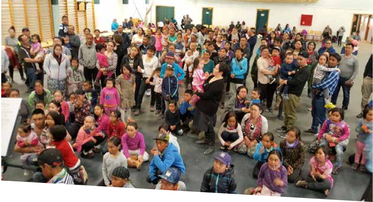
Meeqqat ilaqutaasalu tusamaaraat MIO'p meeqqat pisinnaatitaaffii pillugit atuarimmi meeqqat qanoq ilinniartittamerai.