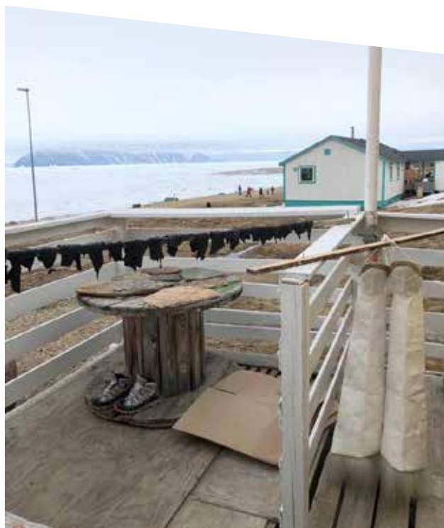
Qaanaaq juuni 2018

Qaanaap nunaqarfiini Qeqertami, Siorapalunni, Savissivimmilu meeraqarpoq ima amerlassusilinnik 7, 13 aamma 16.