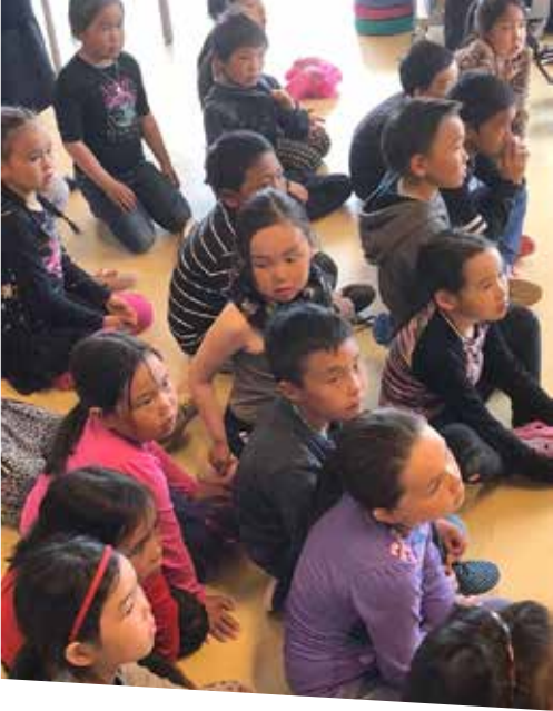
Kingornatigut meeqqallu eqqartortapagut suut titartarsimaneeraat allassimaneeraalluunniit. Taakkualu Meeqqat Pisinnaatitaaffii pillugit isumaqatigiisummi allassimasunut qanoq attuumassuteqartiginersut eqqartortarlutigu.